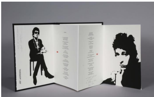
Collection Leporello des éditions Dumerchez, sérigraphie originale rehaussée aux pochoirs de Jef Aérosol et poème de Zéno Bianu, 2015.

peinture à l'huile. Aliska Lahusen , quant à elle, sculpte le plomb et le verre. Elle travaille sur des feuilles de plomb et avec la laque chinoise, dans des noirs et gris aux formes dépouillées. Une salle est consacrée à Jean-Luc Parant dont l'exposition accueille la bibliothèque idéale (en cire) ainsi que des boules qui sont la marque de fabrique de son travail artistique.